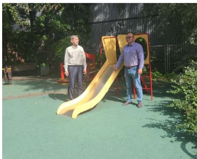
На Днепропетровской ул., 6 специалисты администрации муниципального округа оценили качество нового покрытия и окраски оборудования на детской площадке.