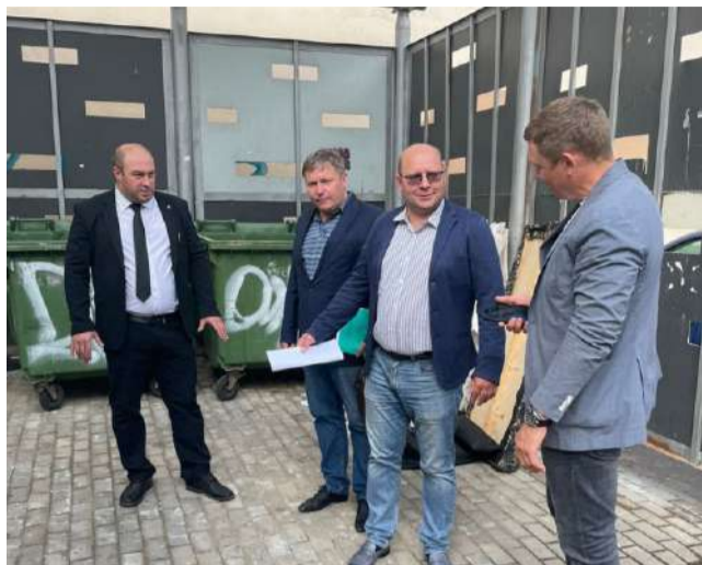
На Полтавской ул., 14 специалисты администрации оценили состояние покрытия на контейнерной площадке.