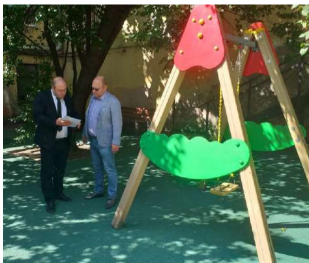
Гончарная ул., 18. Уложено полимерное покрытие. Произведена окраска игрового оборудования.