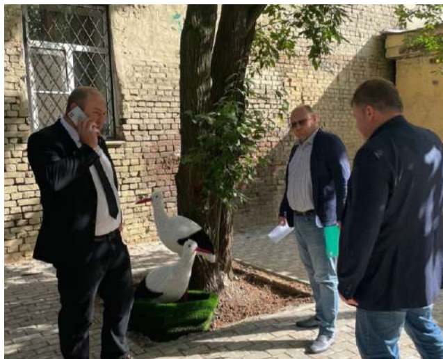
На Миргородской ул., 10 подрядчики закончили ремонт брусчатки. В планах администрации муниципального округа дальнейшее благоустройство двора.