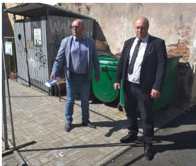
На месте снесенного гаража на контейнерной площадке по Гончарной ул., 17-19 уложена брусчатка.