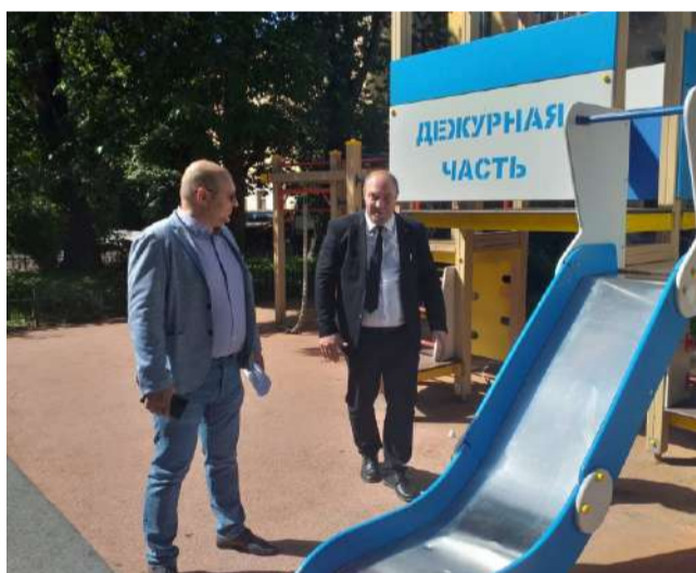
Врио главы и специалисты местной администрации проверили качество ремонта детской площадки на Гончарной ул., 23.