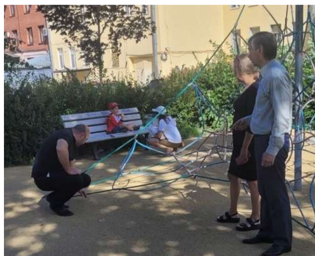
На детской площадке на Днепропетровской ул., 26-28 специалисты администрации муниципального округа проверили качество нового покрытия и пообщались с ребятами и взрослыми.