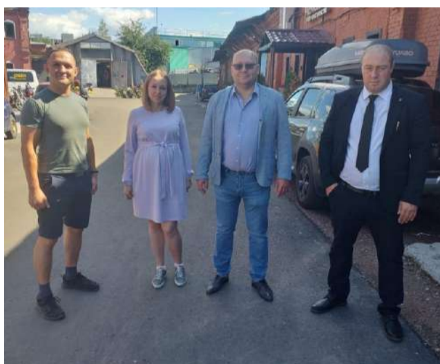
На Лиговском проспекте, 50 стройконтроль вместе с арендаторами и специалистами местной администрации проверяют качество работ по укладке асфальта.